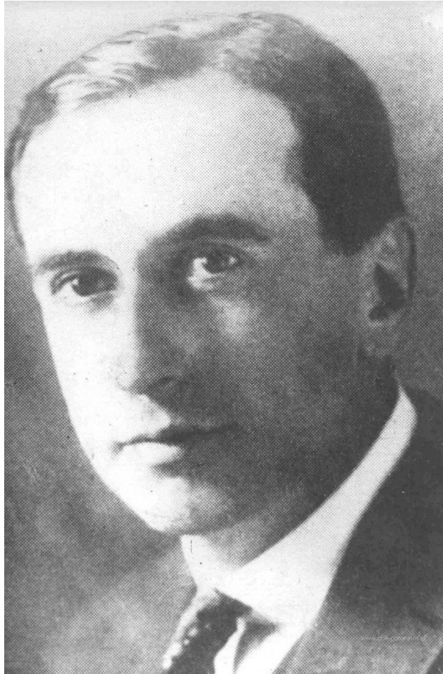
Santiago de Chile, Quilicura.